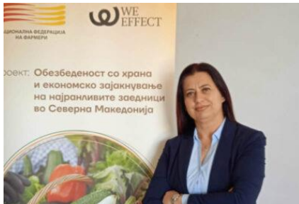
Васка Мојсовска, Претседателка на НФФ